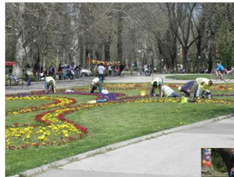
i giardini di Ruse