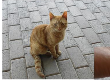
Ai gatti di Ruse piace il salmone