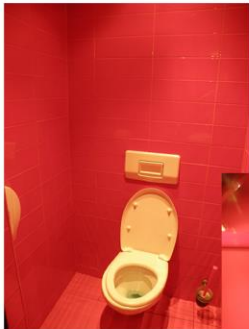
Barbie era di Ruse